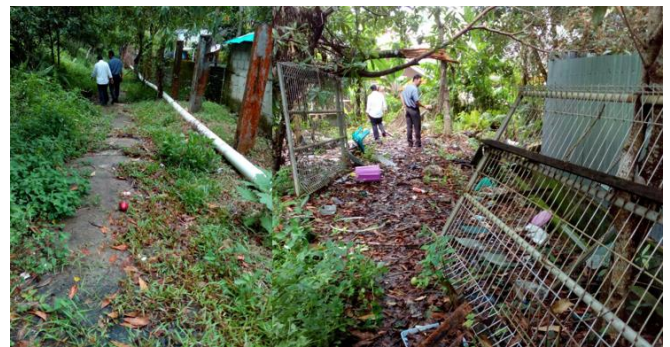
Gambar 3. Kondisi Existing kesan kumuh dan tidak terawat