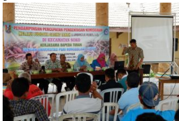
Gambar 1. Pemberian Materi Cacing Tanah

Kegiatan Pengabdian Kepada Masyarakat dilaksanakan pada Hari Minggu tanggal 03 Oktober 2018. Kegiatan PKM dilaksanakan di Balai Desa Pandan Wangi Kecamatan Soko. Pada tahap pelaksanaan PKM dimulai dari pemberian materi kemudian praktek kegiatan budidaya cacing tanah ( lumbricus rubellus ). Berikut disajikan beberapa dokumentasi tentang kegiatan PKM.