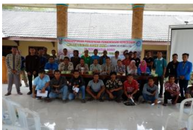
Gambar 3. Peserta Pendampingan dan Pelatihan Cacing Tanah