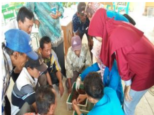
Gambar 2. Praktek pemilahan Bibit Cacing Tanah