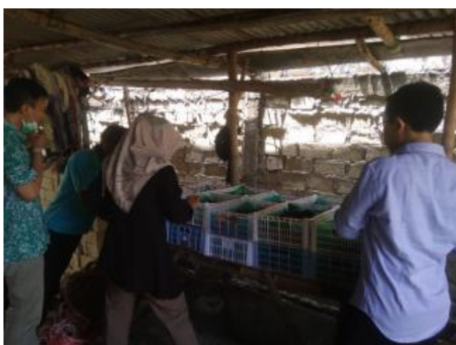
Gambar 4. Monitoring dan Evaluasi Cacing Tanah