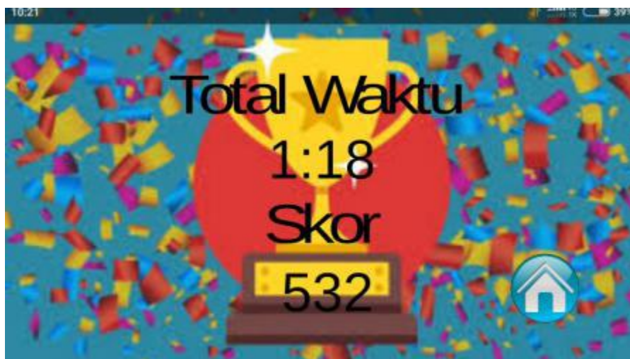
Gambar 11. Tampilan Halaman Skor

Pengujian sistem merupakan tahap terakhir dalam pembangunan sistem. Pada tahap ini, sistem akan diuji coba baik itu dari segi logika dan fungsi-fungsi agar layak untuk diimplementasikan. Teknik pengujian ini menggunakan metode pengujian yang Black Box Testing . Pengujian Black Box menitik beratkan pada fungsi aplikasi. Metode ini digunakan untuk mengetahui apakah perangkat lunak berfungsi dengan benar dan sesuai dengan yang diharapkan. Pengujian dapat di lihat pada table berikut: