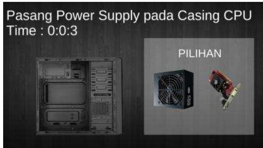
Gambar 5. Tampilan Pemasangan Power Supply