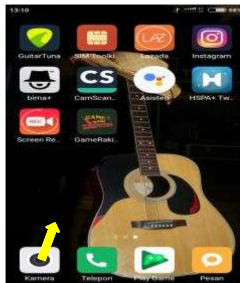
Gambar 2. Tampilan Icon Game

Dalam implementasi dan pengujian menggunakan smartphone xiami redmi 3 dengan ukuran layar 4.0 inches 720 x 1280 pixels dan menggunakan sistem operasi android 5.1 Lollipop . Tampilan icon game perakitan komputer dapat dilihat sebagai berikut: