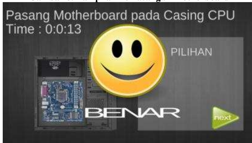
Gambar 9. Tampilan Pemasangan Benar