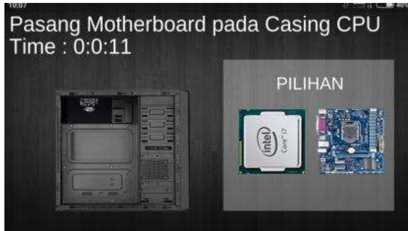
Gambar 8. Tampilan Pemasangan Motherboard