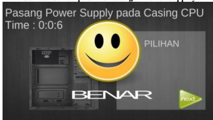
Gambar 6. Tampilan Pemasangan Benar