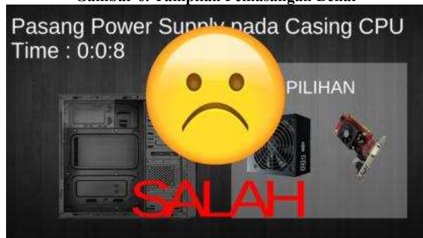
Gambar 7. Tampilan Pemasangan Salah