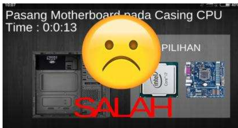
Gambar 10. Tampilan Pemasangan Salah