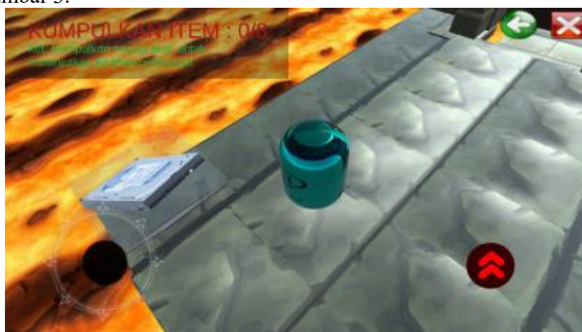
Gambar 4. Tampilan Bermain Level 1

Pada halaman bermain level 1 menampilkan player dan 2 buah button yang bisa diklik dan digerakkan dan mempunyai fungsi dari setiap masing-masing layoutnya . Tampilan dapat dilihat pada gambar 3.