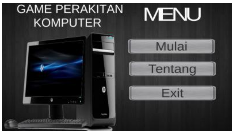
Gambar 3. Tampilan Halaman Awal

Pada halaman bermain level 1 menampilkan player dan 2 buah button yang bisa diklik dan digerakkan dan mempunyai fungsi dari setiap masing-masing layoutnya . Tampilan dapat dilihat pada gambar 3.