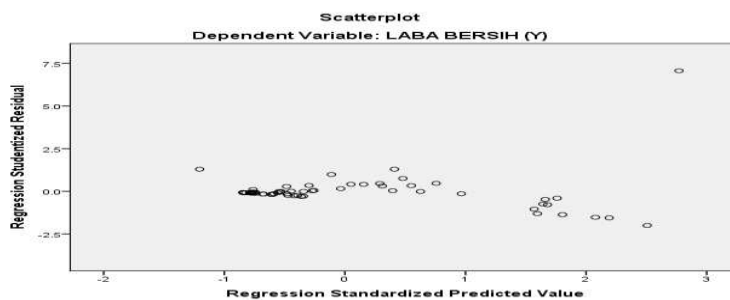
Gambar 3.2 Hasil Uji Heteroskedastisitas

Dilihat dari hasil gambar diatas, data masih menyebar secara acak dan dapat disimpulkan bahwa data bebas dari masalah heteroskedastisitas.