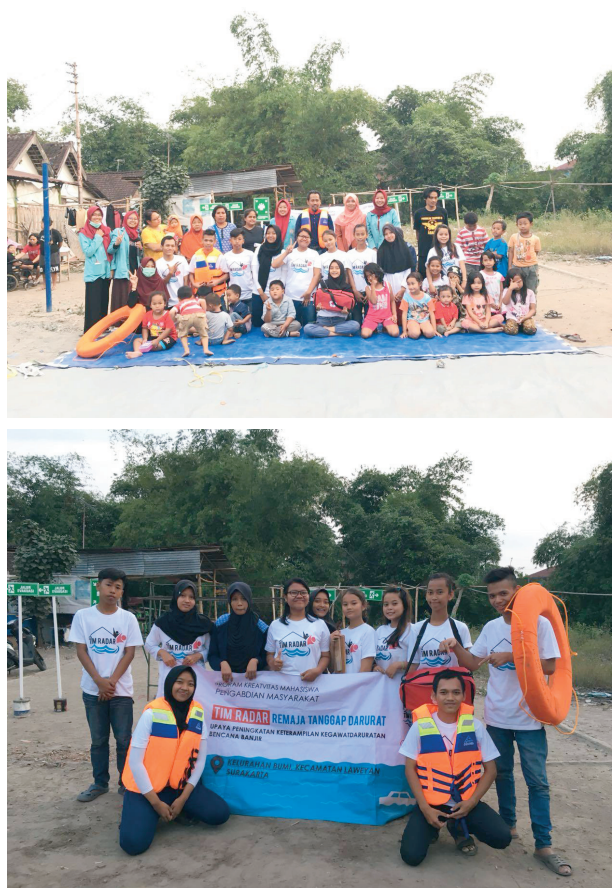
Gambar 1. Training dan Simulasi Kegawatdaruratan Tim Radar

Dengan demikian tingkat kematian akibat bencana banjir akan berkurang. Usaha untuk meningkatkan pengetahuan yaitu dengan memberikan pendidikan kesehatan, seperti yang dikemukakan oleh Notoatmodjo (2003) bahwa pendidikan kesehatan merupakan suatu