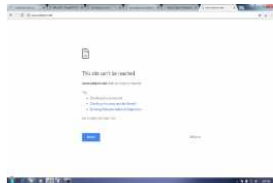
Gambar 4.20 www.cokporn.net

Berikut ini merupakan tampilan hasil pemblokiran situs pornografi www.cokporn.net dapat kita lihat pada gambar 4.20.