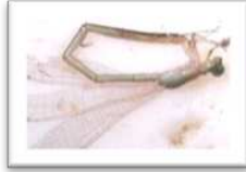
Gambar 4 : Famili Coenagrionidae Sumber : Koleksi Pribadi (2014)