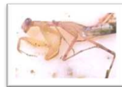
Gambar 3 : Famili Mantidae