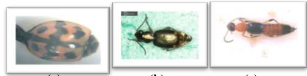
Gambar 1 : (a) Famili Coccinellidae, (b) Famili Carabidae dan (c) Famili Staphylinidae