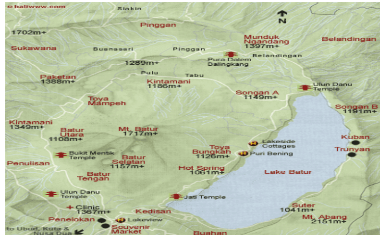
Gambar 1. Peta Kecamatan Kintamani