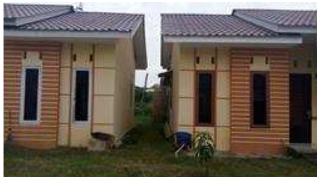
Gambar 1.4 Sampel 1

Berdasarkan wawancara, sebagian besar pemilik rumah bekerja sebagai pegawai swasta, guru, pedagang kecil, bahkan pengemudi dan pengemudi becak. Selama pengamatan, peneliti melihat bahwa ada beberapa pemilik rumah dari komunitas kelas menengah ke atas. Ini bertentangan dengan tujuan pengadaan rumah sederhana yang ditujukan untuk masyarakat ekonomi bawah. Ini ditemukan di ketiga lokasi sampel. Penelitian ini juga menemukan yang sama dengan penelitian sebelumnya. Ditemukan bahwa rumah unit tidak sehat. Lubang ventilasi masih sangat sedikit (Gbr.1.4); semua sampel memiliki lubang ventilasi di bawah 5 persen sebagaimana ditentukan oleh rumah sehat dengan harga sederhana. Jika ini berjalan maka mau tidak mau, penghuni akan dipaksa untuk memakai AC, dan itu sangat memberatkan karena penghuni adalah masyarakat berpenghasilan rendah.