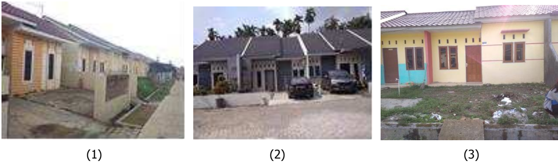
Gambar 1.1 Tiga Sampel

Penelitian ini memakai metodologi analisis deskriptif. Dengan metode ini, tidak perlu melakukan uji validitas dan reliabilitas pada kuesioner. Faktor-faktor dihitung dengan menganalisis frekuensinya.