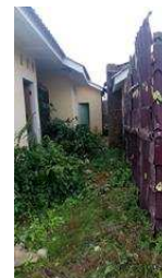
Gambar 1.5 Sampel 1