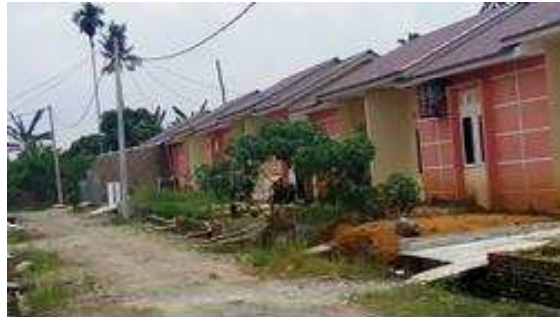
Gambar 1.3 Sampel 1