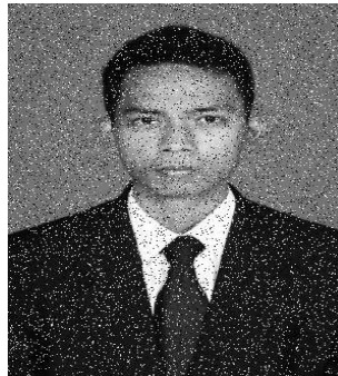
Gambar 3.1. Citra Bernoise

yang lebih jelas dengan cara mereduksi noise pada citra tersebut. Adapun resolusi citra berikut adalah 300x448.