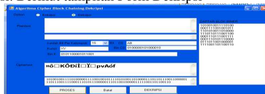
Gambar 4 Gambar Form Tampilan Dekripsi

From Dekripsi berfungsi untuk melakukan proses dekripsi, dimana user harus menginput teks yang akan di dekripsi. Berikut tampilan Form Dekripsi