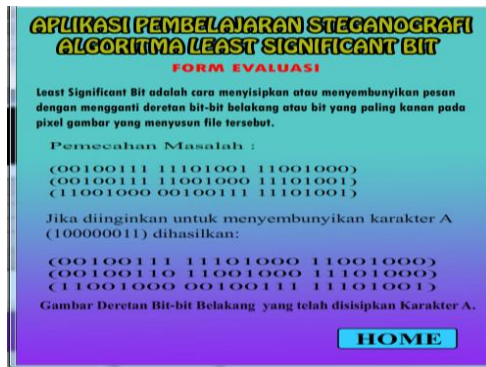
Gambar 5. Tampilan Evaluasi