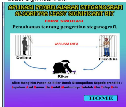
Gambar 6. Tampilan Simulasi

Pada halaman simulasi ini terdapat simulasi tentang steganografi algoritma Least Significant Bit .