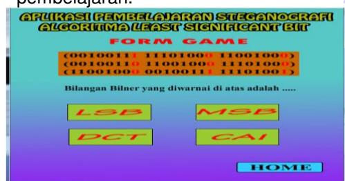
Gambar 8 Tampilan Game

Pada halaman game ini terdapat game sebagai pemberian pembahasan lebih dan sekaligus mengasah otak dalam pembelajaran.