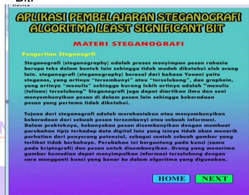
Gambar 3. Tampilan Tutorial

Pada halaman ini terdapat tutorial tentang Steganografi algoritma Least Significant Bit .