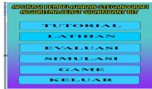
Gambar 2. Tampilan Menu Utama

Halaman Awal menampilkan judul aplikasi pembelajaran Stegga Algoritma Least Significant Bit (LSB) dengan metode Computer Assisted Instruction (CAI). Halaman Menu utama menampilkan pilihan menu yang tersedia pada program.