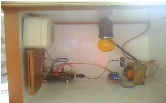
Gambar 3.3 Bentuk Fisik Alat

Rancangan fisik prototype rangkaian kamar tidur dengan menggunakan sensor infrared dan sensor photodiode adalah sebagai berikut