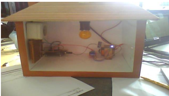
Gambar 4.2 Pengecekan Rangkaian Keseluruhan Bekerja dengan Baik

Beberapa aspek yang perlu dikembangkan dalam pemahaman terhadap sistem merupakan satu kesatuan prosedur inti dari sistem tersebut. Sistem dikatakan lengkap bila dalam mencapai tujuan yang telah ditetapkan terjadi interaksi antara subsistem-subsistem yang ada. Pada sub bab berikut ini akan dijelaskan mengenai analisa perancangan rangkaian secara keseluruhan dan masing-masing yang mendukung tercapainya tujuan pembuatan alat ini.