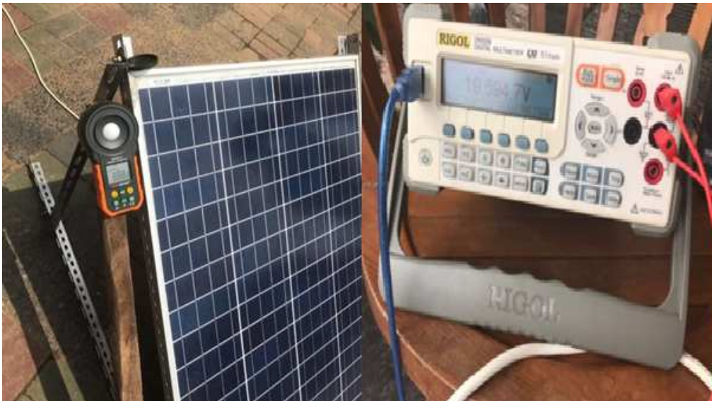
Gambar 2. Pengujian potensi luaran panel surya

Pengujian dilakukan dengan posisi farming dan dudukan tetap(tanpa mengikuti arah matahari), dimana panel surya ditempatkan di halaman ditempat terbuka seperti pada gambar 2 di atas. Pengujian farming dipilih dengan tujuan agar lebih mengacu pada perencanaan yang akan diterapkan di lingkungan ITERA. Selain itu dengan secara farming maka nilai luaran panel surya yang didapat adalah nilai potensi luaran kondisi minimum yang dapat dilihat di lingkungan ITERA saat ini.