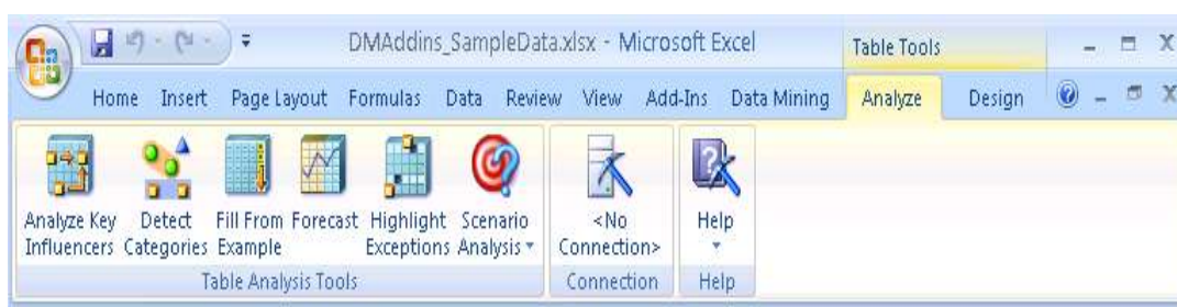
Gambar 2. Toolbar dari Tabel Tools

Tampilan ribbon menu table tools adalah seperti gambar-3 berikut ini.