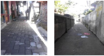
Gambar 2. Kondisi Fisik Lingkungan di Kelurahan Karang Pule

yang ada sebagian besar sudah menggunakan beton, namun ada beberapa jalan yang masih merupakan jalan setapak.