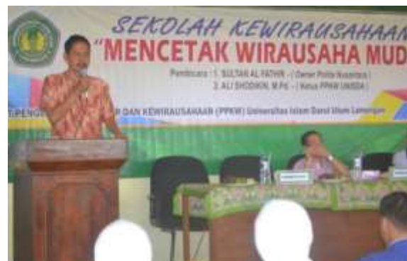
Gambar 2. Sekolah Kewirausahaan

pentingnya berwirausaha dari pengalaman pribadi owner CV. Polita Nusantara dan penyusunan rencana bisnis oleh Ketua Pusat Pengembangan Karir dan Kewirausahaan UNISDA. Kegiatan ini diikuti oleh 198 peserta dari mahasiswa dan alumni. Terlihat antusiasme peserta dalam mengikuti kegiatan, baik saat penyampaian materi, diskusi, tanya jawab hingga pembuatan rencana bisnis.