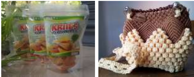
Gambar 3. Beberapa produk hasil PPK

Untuk membangun keterampilan produksi, tenant juga diberikan praktek pembuatan produk. Dalam kegiatan ini, karena beragam produk tenant yang ada, pelaksanaan workshop terbatas pada produk makanan. Kegiatan praktik lainnya yang dilakukan adalah kunjungan industri UMKM dan magang di industri.