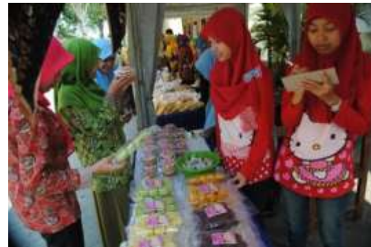
Gambar 5. Pameran kewirausahaan produk PPK

Pembinaan pemasaran yang dilakukan tidak hanya pemasaran secara konvensional ( offline ), tetapi juga melalui online. Pembinaan dalam pembuatan dan pemasaran via facebook dan instagram dilakukan untuk meningkatkan peluang pasar. Selain itu, PPK memfasilitasi tenant untuk memasarkan produknya melalui kegiatan pameran baik diselenggarakan oleh UNISDA maupun di luar UNISDA, seperti UNISDA Expo, Bazar wisuda, pameran produk unggulan kewirausahaan mahasiswa.