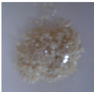
Gambar 3. Kristal andrografolid hasil isolasi

Pada tahap kristalisasi dan rekrystalisasi, diperoleh isolat andrografolid dengan warna putih susu, berbentuk kristal besar sebanyak 4,83 g dengan rendemen sebesar 0,48 %.