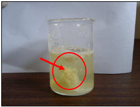
Gambar 1. Hasil Identifikasi Kandungan Bromelain

Dengan membandingkan profil kromatogram ester standar asam oleat dan asam linoleat dengan profil kromatogram blanko, diketahui waktu retensi asam oleat adalah 8,7 menit (lingkaran hijau) dan waktu retensi asam linoleat adalah 9,3 menit (lingkaran merah) (Gambar 2).