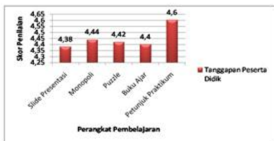
Gambar 1 Respon Peserta Didik

Pada angket respon peserta didik tersedia pernyataan sangat setuju, setuju, kurang setuju, tidak setuju, dan sangat tidak setuju.