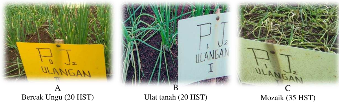
Gambar 1. Gejala Serangan Hama dan Penyakit Tanaman

Hasil analisis ragam menunjukkan bahwa jarak tanam berpengaruh terhadap tinggi tanaman pada umur 35 HST. Hasil uji faktor tunggal disajikan pada Tabel 3. Tabel 3. menunjukkan bahwa jarak tanam 15 cm × 15 cm memberikan hasil terbaik terhadap tinggi tanaman