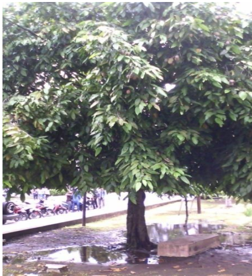
Gambar 1. Contoh Pertumbuhan dan Produksi Tanaman Atung pada Lokasi Kampus Unpatti

Berdasarkan orientasi lapangan yang penulis lakukan tentang kondisi lahan tempat tumbuh tanaman Atung di lokasi kampus Unpatti poka, dapat disimpulkan bahwa tanaman Atung cenderung tumbuh optimal pada wilayah pesisir dengan jenis tanah Regosol halus berwarna hitam hingga agak kekuningan ke dalam tanah (pengaruh warna pasir halus), dengan kondisi iklim yang di bagi menjadi 3 bagian yaitu: curah hujan 3725 mm, temperatur 24,2°C, kelembaban 78%. Kondisi Fisiografi untuk ketinggian 8 mdpl, lereng 2%(datar), untuk kondisi tanahnya kedalaman >100 cm, tekstur pasir berlempung, lempung berdebu, pasir, struktur lepas atau gembur, serta drainase tanahnya baik. Pada studi awal ini, jumlah buah Atung (Gambar 1) per pohon berkisar 83 buah, bahkan ada tiga buah yang telah jatuh atau gugur secara alamiah.