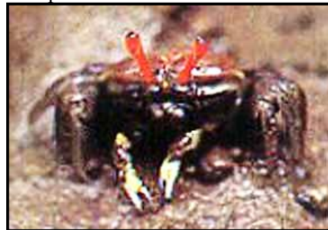
Gambar 9. Uca paradussumieri

Disebut juga kepiting biola ungu ( purple fiddler ). Merupakan kepiting mangrove yang obligat (hidupnya tergantung/harus berasosiasi dengan mangrove). Sering ditemukan pada lumpur lunak. Juvenil berkembang dalam lubang (liang). Distribusi (daerah penyebarannya) di Indo-Pasifik Barat meliputi India Timur Laut, Thailand, Indonesia, Malaysia, Kamboja, dan China.