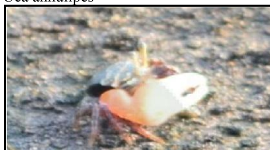
Gambar 3. Uca annulipes

Berukuran tubuh 25 – 60 mm, karapas berbentuk trapesium berwarna hitam dengan bintik-bintik putih melintang dekat anterior, orbit tidak tampak, merus, carpus dan manus berwarna merah, halus, dactyl dan pollex berwarna putih. Menurut Wilsey (2000) menyatakan bahwa beberapa jenis Uca dapat hidup bersama di habitat yang sama, tetapi jenis-jenis tersebut biasanya memiliki pola tingkah laku yang berbeda serta memiliki mikrohabitat yang juga berbeda sehingga relung ekologi dari kepiting ini dapat saja terpisah. Distribusinya di Indo-Pasifik Barat meliputi India sampai China selatan, Filipina, Indonesia, dan Malaysia.