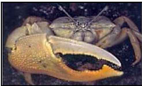
Gambar 5. Uca vocans

Uca vocans berukuran tubuh 30 – 75 mm, karapas berbentuk trapesium berwarna putih pudar, orbit melekuk tajam, merus dan carpus berwarna putih keabu-abuan, manus berwarna kuning, kasar, dactyl berwarna putih, pollex berwarna kuning. Uca vocans biasanya muncul setelah surut rendah yang berdekatan dengan batas air. Uca vocans ditemukan di daerah yang berlumpur sedikit berpasir dengan kadar air yang tinggi dipinggiran hutan mangrove yang terbuka. Menurut Wilsey (2000) menyatakan kepiting fiddler bersifat semiterrestrial serta aktif pada saat air surut. Distribusinya di Indo-Pasifik Barat meliputi China, Birma, Thailand, Indonesia, dan Malaysia.