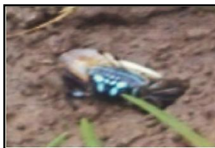
Gambar 4. Uca vomeris