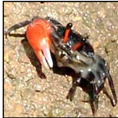
Gambar 6. Uca rosea

Uca rosea hidup pada substrat berlumpur dekat perairan dan vegetasi, ditemukan di sekitar tepi perairan / muara. Memiliki karapas berwarna hitam dan capit besar berwarna merah, karapasnya berbentuk segi empat, dan ujung karapas tumpul, bagian dorsal memanjang pada bagian atas, dan bagian bawah sedikit menyempit, ukuran panjang karapas 10 mm, dan lebar karapas 15 mm. Thorax berwarna hitam, dan abdomen berwarna hitam melengkung, sedikit beruas, capitnya berwarna merah dan di ujung capit berwarna putih, pada permukaan capit bergerigi dan berlekuk, terdapat bintik-bintik kasar berwarna hitam, merah, panjang propodus (panjang capit) 15 mm. Tangkai mata dan bintik matanya berwarna hitam, memiliki 4 pasang kaki jalan, dan sepasang capit. Kakinya berwarna hitam, dan capit yang kecil juga berwarna hitam. Menurut Wulandari (2013) Uca rosea jantan memiliki bentuk abdomen yang memanjang dan pada betina lebar dan tumpul. Bagian frontal karapas lebar, ukuran lebar karapas jantan dewasa mencapai 27,5 mm. Hidup pada substrat lumpur dekat sungai dan selalu dekat vegetasi (Murniati, 2010). Distribusinya di Indo-Pasifik Barat meliputi India bagian barat sampai Malaysia dan Indonesia bagian barat.