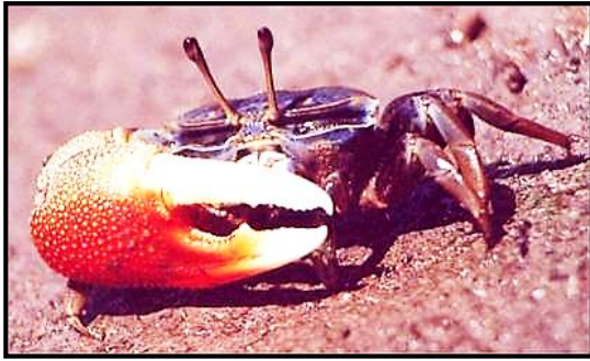
Gambar 7. Uca tetragonon

Uca tetragonon berukuran tubuh 30 – 75 mm, karapas berbentuk trapesium berwarna hitam dengan bintik-bintik biru melintang, orbit tidak tampak, carpus tungkai belakang berwarna biru di bagian tengah, merus berwarna oranye, carpus tungkai paling depan berwarna oranye pudar, manus bagian dorsal berwarna coklat keputihan, bagian ventral berwarna oranye, kasar, dactyl dan pollex berwarna putih. Uca tetragonon hanya ditemukan di titik 1-5 yang jauh dari zona intertidal dengan vegetasi Rhizophora sp. yang berdekatan dengan jalan tol dan pemukiman warga. Yulianto (2006) menyatakan bahwa kepadatan jenis Uca tetragonon dipengaruhi oleh tingginya frekuensi habitat terendam air. Menurut Suzuki dan Hatori (1998) dalam suatu populasi jenis Uca tetragonon betina lebih sering ditemukan daripada yang jantan, sehingga pemanfaatan capit yang besar untuk berkompetisi tidak bisa dilakukan yang menyebabkan individu semakin berkurang (Crane, 1975). Distribusinya di Indo-Pasifik Barat meliputi Afrika Selatan sampai Iran, Madagaskar, Thailand, Malaysia, Australia, Indonesia, Filipina, Papua Nugini, Taiwan, Mikronesia, dan Melanesia.