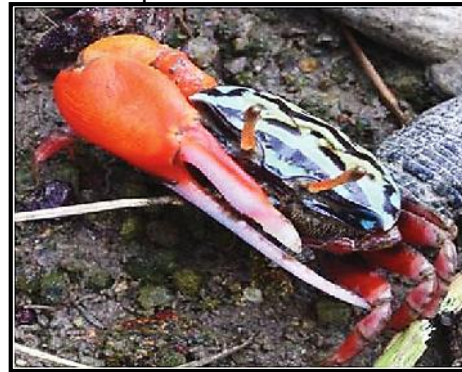
Gambar 8. Uca crassipes

Capit besar berwarna orange kemerahan dengan bagian bawah capit lebih panjang. Lebar karapas antara 2-2,5 cm dengan warna hijau hitam dan kaki jalan berwarna merah dengan jumlah 4 pasang. Banyak ditemukan pada mangrove bagian hilir sungai dengan tempat yang terbuka. Distribusinya di wilayah Indo-Pasifik Barat meliputi Kaledonia Baru, Australia Timur, Papua Nugini, Filipina, China, dan Kepulauan bagian selatan Jepang.