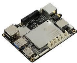
Gambar 2 board LattePanda

LattePanda adalah Mini PC Board dengan Windows 10 Ori Pre-Installed(Support Linux and Arduino) yang memiliki kemampuan Desktop PC.