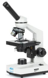
Gambar 1 mikroskop monokuler

Mikroskop Monokuler adalah mikroskop cahaya yang hanya dilengkapi dengan satu jenis lensa okuler. Adapun fungsi dari mikroskop monokuler adalah untuk mengamati secara lebih terperinci struktur di dalam sel.