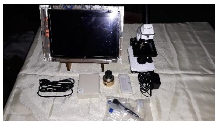
Gambar 4 hasil perancangan

Untuk memastikan apakah guru dan siswa sudah dapat menggunakan hasil dari kegiatan ini maka akan dilakukan monitoring dan evaluasi. Untuk penyempurnaan mikroskop digital ini