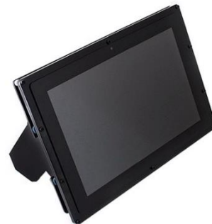
Gambar 3 LCD

Pada LCD berwarna semacam monitor, terdapat banyak sekali titik cahaya (piksel) yang terdiri dari satu buah kristal cair sebagai sebuah titik cahaya. Walau disebut sebagai titik cahaya, kristal cair ini tidak memancarkan cahaya sendiri. Sumber cahaya di dalam sebuah perangkat LCD adalah lampu neon berwarna putih di bagian belakang susunan kristal cair.