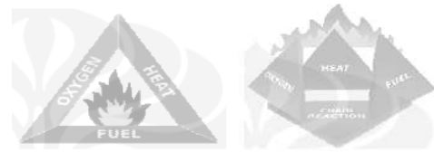
Gambar 1 (a) Fire Triangle (b) Tetrahedron of Fire

akan terputus dan menghasilkan radikal oksida. Pada proses pemutusan rantai, terjadi pelepasan energi yang tersimpan di dalam rantai tersebut.