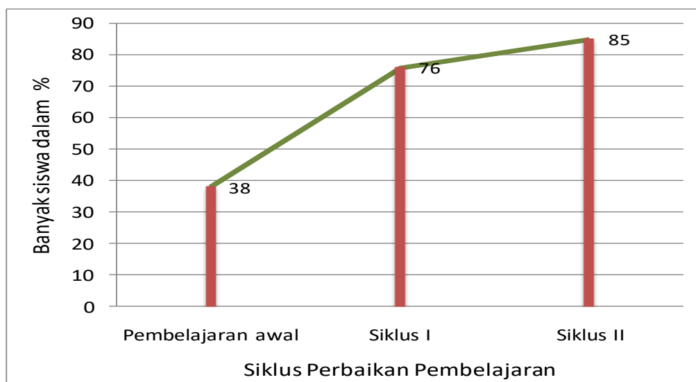
Gambar 2. Peningkatan Ketuntasan Hasil Belajar

Pada nilai rata-rata juga mengalami peningkatan yang cukup signifikan, yaitu sebelum perbaikan pembelajaran rata-rata nilai yang diperoleh adalah 55, pada perbaikan pembelajaran siklus I adalah 72 dan pada perbaikan pembelajaran siklus II adalah 79,2. Jika hasil ketuntasan dan rata-rata nilai tersebut disajikan dalam bentuk grafik maka akan terlihat seperti pada gambar berikut ini: