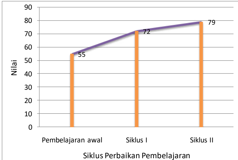
Gambar 3. Peningkatan Nilai Rata-rata Hasil Belajar

Pada gambar 3 menunjukkan peningkatan nilai rata-rata mata pelajaran IPA dengan materi lambang bilangan romawisebelum perbaikan pembelajaran (pra siklus) nilai rata-rata 55,3 pada perbaikan pembelajaran siklus I nilai rata-rata naik menjadi 72,3 dan pada perbaikan pembelajaran siklus II naik lagi menjadi 79,2. Kenaikan nilai rata-rata tersebut merupakan tanda keberhasilan proses perbaikan pembelajaran.