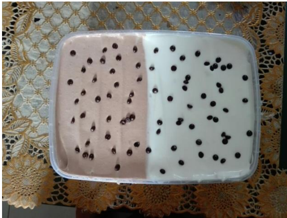
Gambar 9. Sebelum ditambah ekstrak strawberry