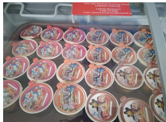
Gambar 8. Produk sudah memiliki merek atau logo