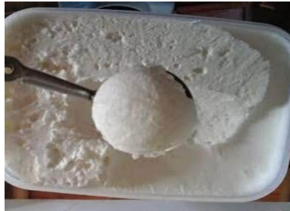
Gambar 10. Setelah ditambah ekstrak strawberry