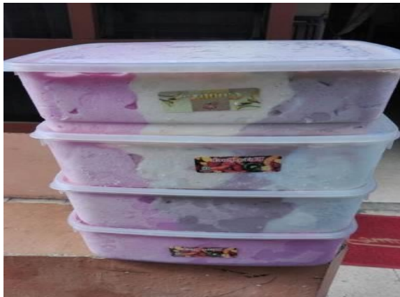
Gambar 7. Produk belum memiliki merek atau logo

strawberry kedalam adonan es krim. Penambahan ekstrak ini bertujuan untuk menjadikan es krim ini unik dan berbeda dari es krim ada umumnya yang beredar di pasaran (Oktavia dan Esti, 2014). Menurut Tiarani (2015), ekstrak strawberry ini mengandung polifenol yang memiliki kemampuan mencegah air dan minyak untuk terpisah, sehingga es krim yang mengandung cairan tersebut bisa mempertahankan bentuk aslinya lebih lama dan sulit mencair.