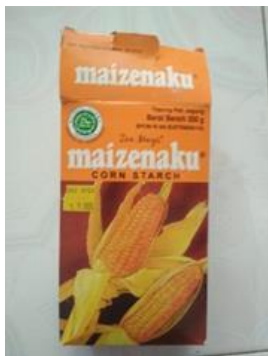
(a) Tepung Maizena