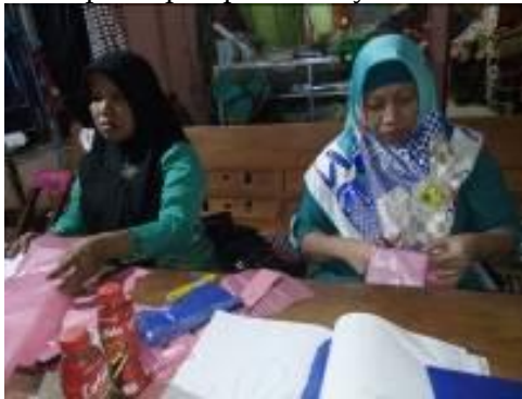
Gambar 4. Pembuatan pola kebaya oleh mitra difabel

Pada tahap pertama merupakan dasar dari cara pembuatan busana kebaya. Hal yang sangat menarik bahwa kebaya adalah model busana yang tidak sama dengan baju pada umumnya. Kebaya adalah busana yang memiliki pola seni yang sedemikian cantik sehingga dalam pembuatannya pula memerlukan teknik dan cara khusus. Pada tahap pelatihan ini konseling yang dilakukan adalah tahap membangun hubungan dalam konseling yaitu memulai konseling pada difabel. Hubungan yang baik antara Tim Program Kemitraan Masyarakat dengan para peserta sangat dibutuhkan sebagai dasar komitmen untuk membangun usaha tata rias salon. Kesempatan ini dilakukan pada tahap pelatihan persiapan pola kebaya.