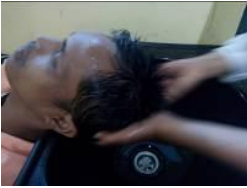
Gambar 10. Pijat kepala yang dilakukan di salon Program Kemitraan Masyarakat