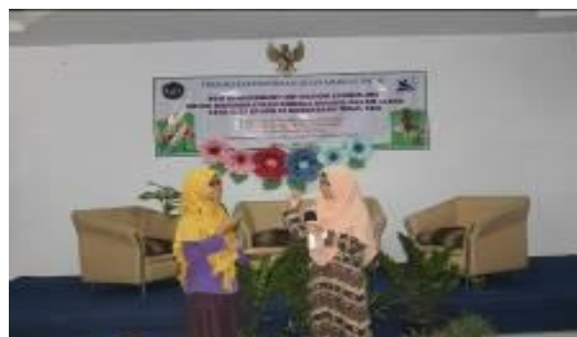
Gambar 1 dan 2: Tim pengabdian kepada masyarakat memberikan materi Achievement Motivation Counseling kepada peserta difabel