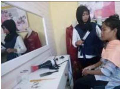
Gambar 11. Proses catok rambut yang dilakukan oleh mitra difabel sebagai bentuk keterampilan usaha tata rias salon

Pangsa pasar yang sangat diminati masyarakat adalah catok rambut. Hal ini yang menjadi dasar bagi Tim Program Kemitraan Masyarakat untuk memberikan pelatihan catok rambut kepada difabel. Pada usaha tata rias salon difabel Program Kemitraan Masyarakat memiliki keuntungan berada di dalam kantor Loka Bina Karya – Difabel Slawi Mandiri Kabupaten Tegal. Informasi dari pegawai yang beraktivitas di kantor dapat mencatok rambut di usaha tata rias salon difabel.