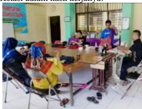
Gambar 6. Pembuatan busana kebaya oleh mitra difabel

yang dirasakan difabel. Empati yang akurat untuk memahami difabel dalam rintisan usaha tata rias salon ini antara lain memahami bahwa difabel memiliki dasar keterampilan yang baik, namun belum dapat optimal dilakukan. Difabel merasa bahwa keterampilan menjahit sebagai dasar usaha tata rias salon pembuatan dan penyewaan kebaya dilihat sebagai peluang yang bagus untuk diri difabel. Peluang ini ditindaklanjuti oleh difabel yang sudah mendapatkan apresiasi dalam hasil kerjanya.