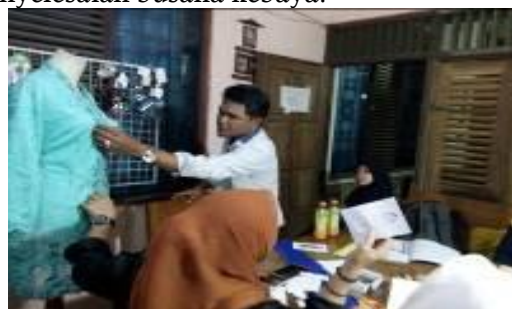
Gambar 3. Mitra dari Program Kemitraan Masyarakat mengikuti pelatihan busana kebaya

Pelatihan yang dilakukan pada PKM “ Achievement Motivation Counseling untuk Meningkatkan Kinerja Difabel dalam Usaha Tata Rias Salon di Kabupaten Tegal“ terdiri dari kegiatan busana kebaya dan tata rias. Pelatihan yang dilakukan pertama adalah dalam busana kebaya. Pentingnya dalam pemilihan busana kebaya pada usaha tata rias salon adalah untuk memberikan peluang usaha kepada difabel dalam membuat dan menyewakan kebaya. Pelatihan busana kebaya yang dilakukan peserta terdiri dari awal pembuatan sampai pada tahap penyelesaian busana kebaya.