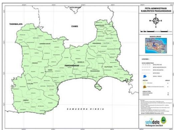
Gambar 2. Peta Kabupaten Pangandaran

berbatasan dengan Desa Batumalang dan Desa Cimerak serta sebelah timur berbatasan dengan Samudera Indonesia (Anonim, Tanpa Tahun). Sebagian besar penduduknya bermata pencaharian sebagai petani dan nelayan.