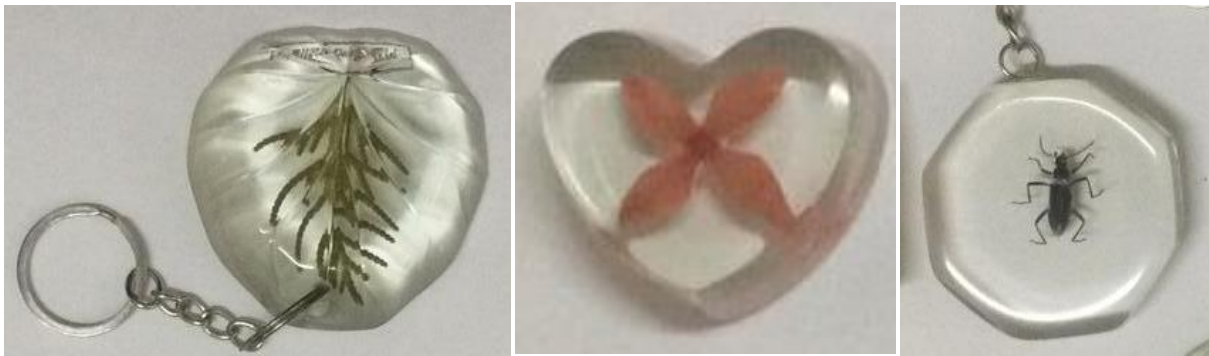
Gambar 3. Gantungan Kunci Bioplastik

Gambar 3 menunjukkan bahwa bahan dasar yang digunakan oleh pemuda Karang Taruna Fajar adalah kerang-kerangan dan hewan yang ada di lingkungan sekitar. Bahan dasar ini banyak ditemukan di daerah sekitar Desa Masawah, dan sudah tidak digunakan bahkan dapat dikategorikan sebagai sampah. Melalui kegiatan ini bahan-bahan yang tadinya dianggap tidak bernilai diubah menjadi sesuatu yang lebih bernilai.