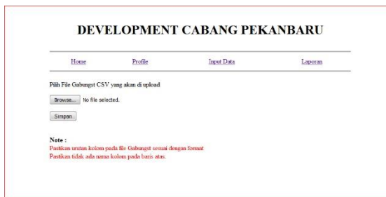
Gambar 3.7 Upload Gabungst

Upload Data Gabung ini berfungsi untuk mengupload data penjualan selama setahun yang sudah dilewati dalam bentuk csv, guna perhitungan Economic Order Quantity di tahun berikutnya.