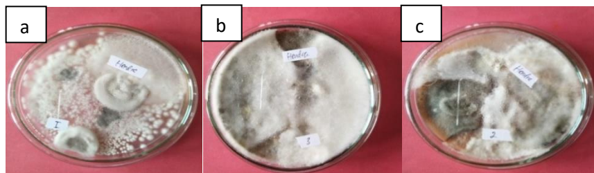
Gambar 1. Jamur endofit dari daun beluntas ( Pluchea indica (L.) Less.) setelah inkubasi selama 2 minggu, (a) Replika pertama, (b) Replika kedua, (c) Replika ketiga.

yaitu medium PDA, karena medium ini berisi nutrisi yang dibutuhkan oleh jamur. Lalu ditambahkan kloramfenikol (PDAC), hal ini dilakukan untuk menekan pertumbuhan bakteri yang kemungkinan ikut tumbuh saat isolasi. Hasil dari isolasi jamur endofit pada ketiga replika setelah dilakukan pengamatan selama 14 hari dapat dilihat pada Gambar 1