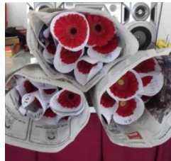
Gambar 2. Bunga gerbera siap dikemas

Produk yang ditawarkan di Kelompok Tani Boemi Nursery yaitu bunga gerbera. Bunga gerbera ini memiliki warna yang bervariasi merah, kuning, oren, pink dan putih. Varietas yang ditanam adalah Gerbera popop, estelle , penny , monaco , roulette , horizon dan king . Bunga gerbera yang dipanen memiliki kelopak bunga yang bagus dan panjang tangkai rata-rata 40 - 65 cm. Bunga gerbera dijual per ikat kecil dengan jumlah satu ikat sebanyak 10 tangkai. Kemudian bunga gerbera dalam ikatan kecil di ikat lagi menjadi ikatan besar dengan jumlah satu ikat besar sebanyak 5 ikat kecil. Sehingga konsumen dapat membeli bunga gerbera potong dengan satu warna atau beraneka warna dalam satu ikat besar, dapat dilihat pada Gambar 2 di bawah ini