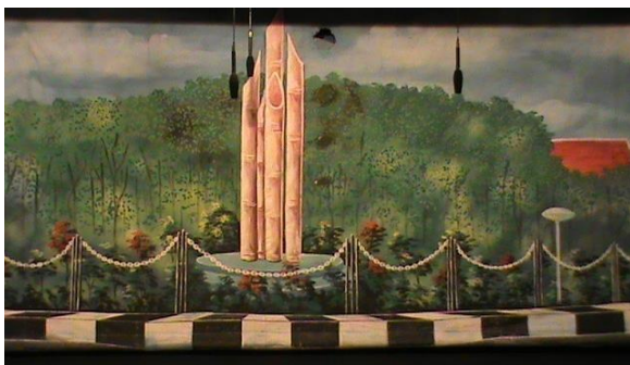
Gambar 1. Jalan Bambu Runcing, menggambarkan taman yang ada bambu runcingnya dengan dikelilingi tanaman

Berkaitan dengan penataan artistik, setting itu harus mengacu terhadap cerita/ lakon yang dipentaskan, kalau misal pertunjukan adegan laut atau adegan sungai, maka dapat digunakan properti tambahan. Jika ada semacam kelir desa dapat ditambah dengan properti yang menggambarkan sungai, maka perlu dibikin properti yang menggambarkan tentang suasana kali. Misalnya cerita tentang bengawan solo yang harus ada properti tambahannya yang kalau dilihat secara artistik hal itu memang harus menggambarkan sungai.