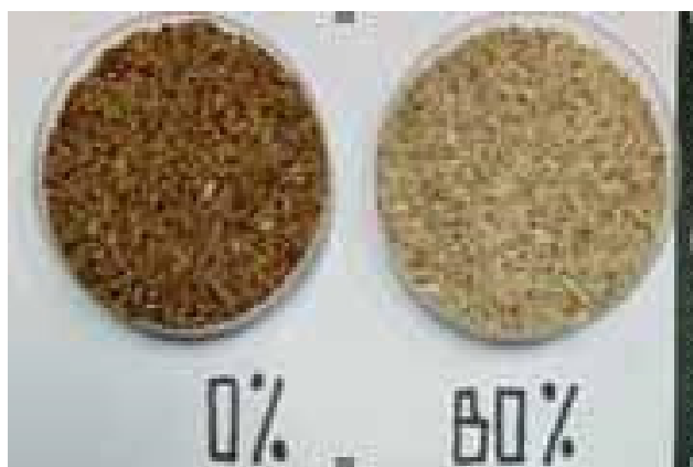
Gambar 1 Beras merah Mayang Pandan DS 0 dan 80%. Figure 1 Mayang Pandan brown rice with MD 0 and 80%.