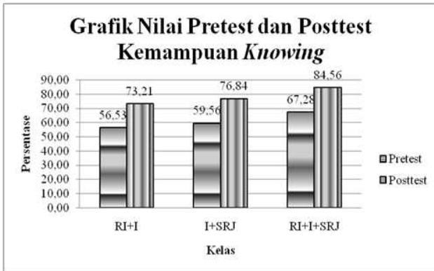
Gambar 1. Grafik Kemampuan Knowing

Skor posttest dan pretest literasi sains pada kemampuan knowing untuk setiap kelas dapat dilihat pada Gambar 1.