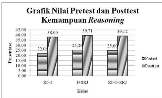
Gambar 3. Grafik Kemampuan Reasoning

Grafik yang menunjukkan skor pretest dan posttest setiap kelas pada kemampuan reasoning ditunjukkan oleh Gambar 3 berikut.