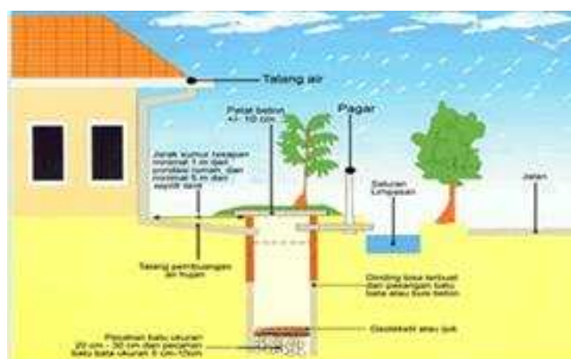
Gambar 1: Sketsa Sumur Resapan

Sumur resapan merupakan skema sumur atau lubang pada permukaan tanah yang dibuat untuk menampung air hujan agar dapat meresap ke dalam tanah. Sumur resapan ini kebalikan dari sumur air minum. Sumur resapan merupakan lubang untuk memasukkan air kedalam tanah, sedangkan sumur air minum berfungsi untuk menaikkan air tanah ke permukaan. Dengan demikian, konstruksi dan kedalamannya berbeda. Sumur resapan digali dengan kedalaman di atas muka air tanah, sedangkan sumur air minum digali lebih dalam lagi atau di bawah muka air tanah (Kusnaedi, 2011).