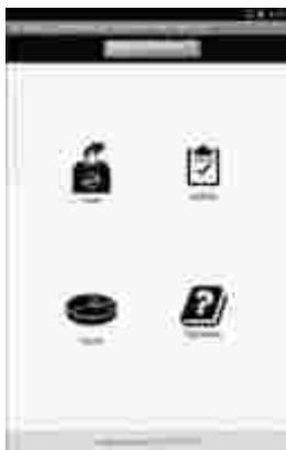
Gambar 2 Tampilan Halaman Utama

Halaman menu utama adalah halaman dimana aplikasi pertama kali dijalankan. Pada halaman ini menampilkan menu seperti gambar berikut: