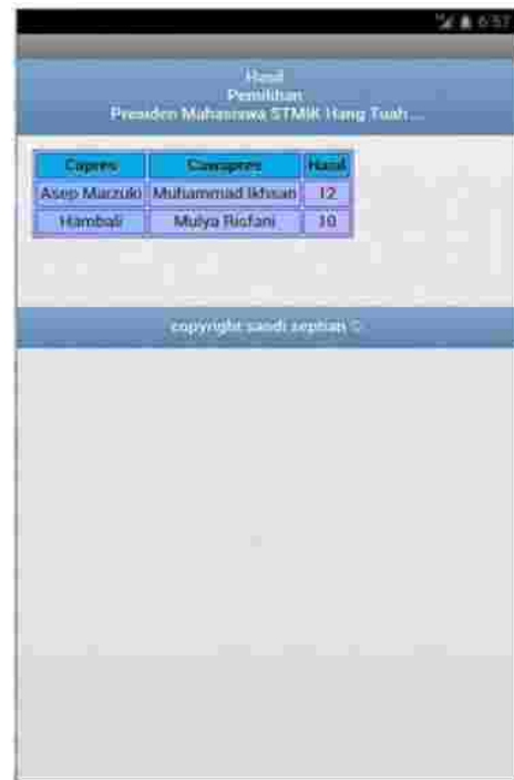
Gambar 8 Tampilan Laporan Hasil Voting

Menu hasil vote adalah halaman yang menampilkan perolehan suara masing-masing kandidat Presiden Mahasiswa STMIK Hang Tuah Pekanbaru, berikut tampilan menu Hasil: