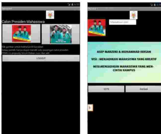
Gambar 6 Tampilan Menu Voting

Menu voting adalah menu yang diakses pemilih guna memberikan hak pilihnya dalam pemilihan Presiden Mahasiswa STMIK Hang Tuah Pekanbaru, berikut tampilan menu voting: