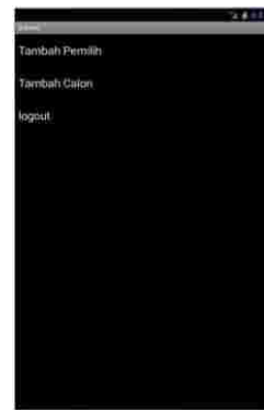
Gambar 4 Tampilan Halaman Admin

Halaman admin adalah halaman yang diakses panitia untuk menambah data calon Presiden Mahasiswa dan data calon pemilih, berikut tampilan menu admin: