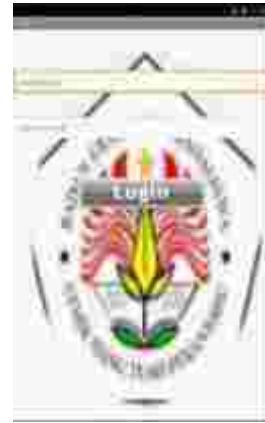
Gambar 3 Tampilan Halaman Login Admin

Halaman admin adalah halaman yang diakses oleh panitia pemilihan Presiden Mahasiswa STMIK Hang Tuah Pekanbaru, halaman ini digunakan untuk menambah data calon Presiden Mahasiswa dan data calon pemilih. Untuk dapat mengakses menu tersebut diperlukan login terlebih dahulu, berikut tampilan menu login admin/ panitia.