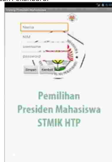
Gambar 5 Tampilan Menu Tambah Data Pemilih

Halaman tambah pemilih adalah halaman panitia untuk menambah data pemilih dalam pemilihan Presiden Mahasiswa STMIK Hang Tuah Pekanbaru.