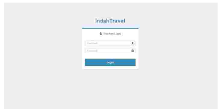
Gambar 1 Tampilan FormLogin