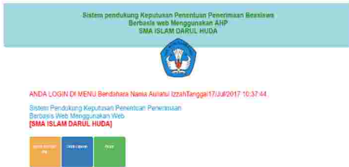
Gambar 11 : Tampilan Menu Bagian Bendahara

Merupakan halaman awal setelah admin melakukan login, pada halaman ini berisi fasilitas admin seperti proses dan hasil AHP, Cetak Laporan, dan Keluar dari sistem. Adapun tampilan halaman bagian (Bendahara) dapat dilihat pada gambar berikut ini :