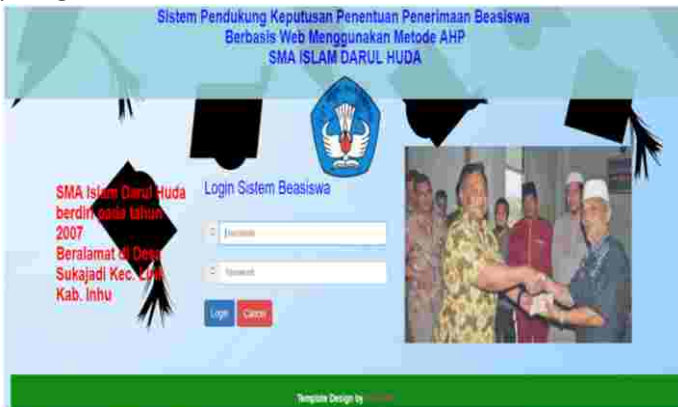
Gambar 2: Tampilan Halaman Login Ke Sistem

Pada tampilan login ke sistem ini merupakan halaman yang berfungsi sebagai security system dan juga berfungsi untuk mengidentifikasi user yang mengakses halaman administrator sistem. Adapun tampilan halaman login kesistem dapat dilihat pada gambar berikut ini.