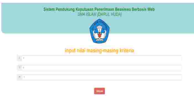
Gambar 8: Tampilan Input Masing-Masing Kriteria

Halaman ini merupakan halaman untuk menambah berita yang akan di tampilkan pada halaman utama yang di kelola oleh admin. Berikut tampilan menu Berita di bawah ini :