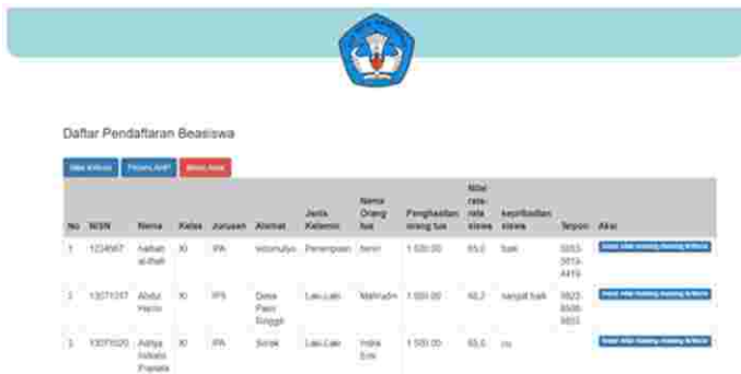
Gambar 6: Tampilan Halaman Menu Verifikasi