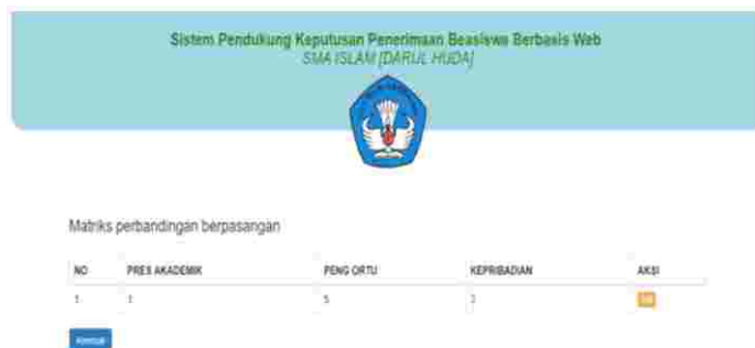
Gambar 7: Tampilan Matriks Perbandingan Berpasangan

Halaman ini merupakan halaman input kriteria proses pemilihan beasiswa yang terdiri dari Prestasi Akademik, Penghasilan orang tua dan Kepribadian, data kriteria tersebut di inputkan oleh admin untuk memproses hasil pemilihan beasiswa. Berikut tampilan proses pemilihan beasiswa di bawah ini :