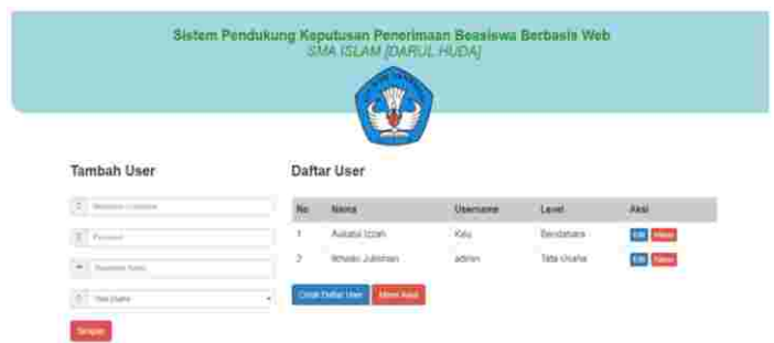
Gambar 5: Tampilan Halaman Add User

Halaman ini merupakan halaman user, admin dapat melakukan tambah user, edit user, hapus user, cetak daftar user dan menu awal. Berikut tampilan menu Add user di bawah ini: