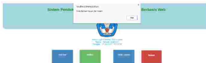
Gambar 10 : Tampilan Halaman Menu Keluar Sistem

Halaman ini admin bisa keluar ke tampilan halaman menu utama, jika ingin keluar dari sistem admin cukup menekan tomnol menu keluar lalu klik oke, sistem akan langsung kembali ke tampilan menu utama pada sistem. Berikut tampilan halaman menu keluar di bawah ini :