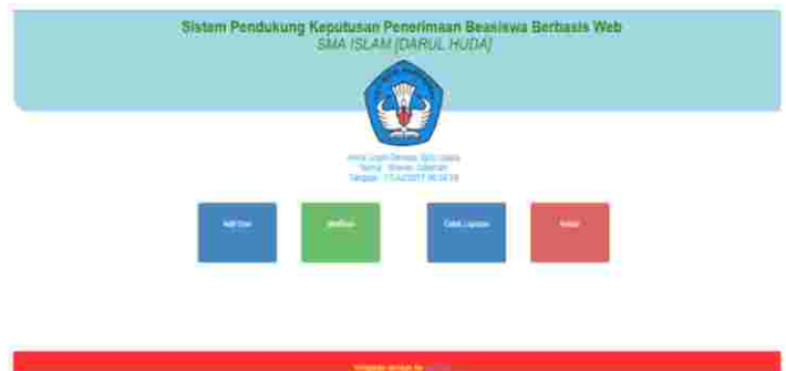
Gambar 4: Tampilan Menu Utama Admin (Tata Usaha)

Halaman Utama Admin merupakan halaman awal setelah admin melakukan login, pada halaman ini berisi fasilitas admin seperti menu Add user, Verifikasi proses beasiswa, Berita, Cetak Laporan, dan Keluar dari sistem. Adapun tampilan halaman admin bagian (Tata usaha) dapat dilihat pada gambar berikut ini :