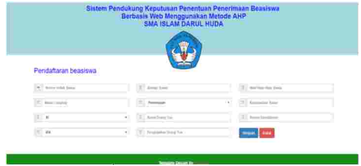
Gambar 3: Tampilan Menu Register

Pada Halaman ini, calon penerima beasiswa dapat mendaftarkan diri dengan mengisi data calon penerima beasiswa dengan benar, jika data sudah di isi dengan benar calon siswa dapat menekan tombol simpan. Berikut tampilan menu register di bawah ini :