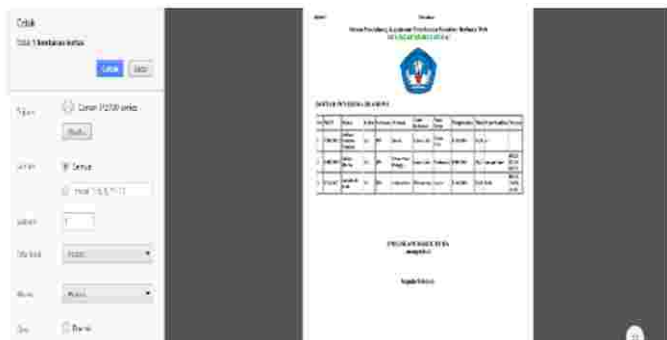
Gambar 12 : Tampilan Menu Cetak Laporan Bagian (Bendahara)