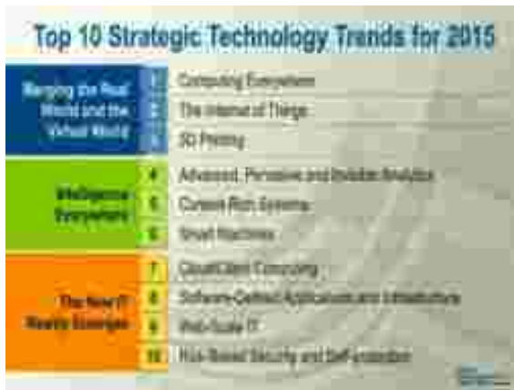
Gambar3. Tren IT 2015 versi Gartner

Analisa lingkungan eksternal SI/TI dilakukan berdasarkan analisa tren teknologi masa kini.Lembaga riset teknologi informasi Gartner menyoroti atas 10 tren teknologi yang strategis bagi sebagian besar organisasi ditahun 2015.Hal ini dikemukakan selama Gartner Symposium/ITxpo pada tanggal 06 Desember 2015.