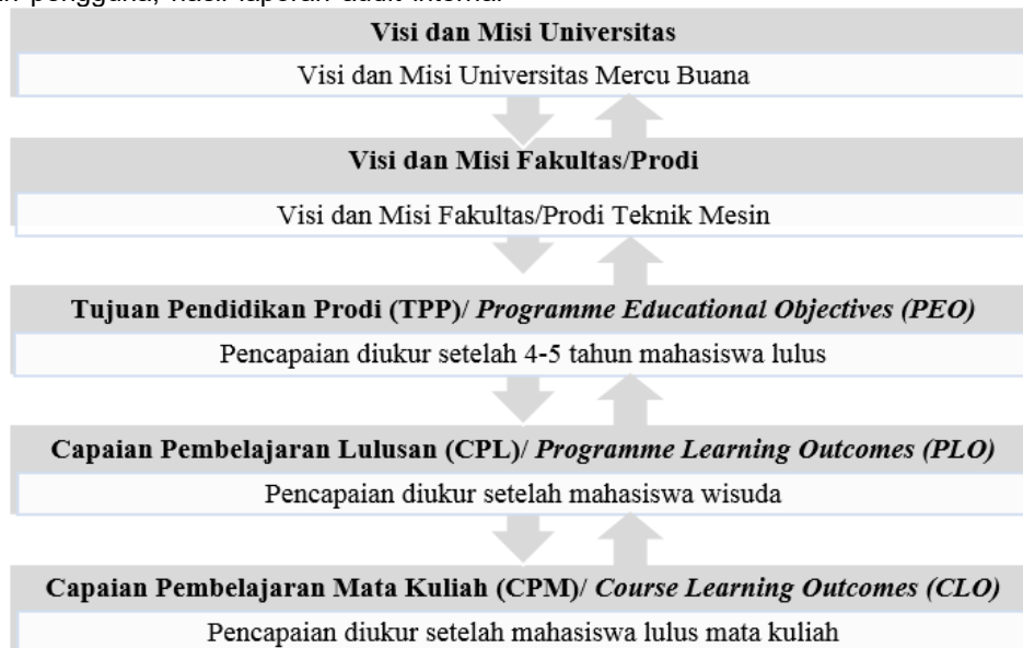
Gambar 3. Alur proses penyusunan kurikulum

Pada Gambar 3 di bawah ini menunjukkan alur proses penyusunan kurikulum dan pelaksanaan sistem pembelajaran. Alur dalam dua arah menunjukkan bahwa semua unsur saling berkaitan. Hal penting yang perlu diingat adalah setiap unsur memiliki kriteria dan harus bisa diukur pencapaiannya.