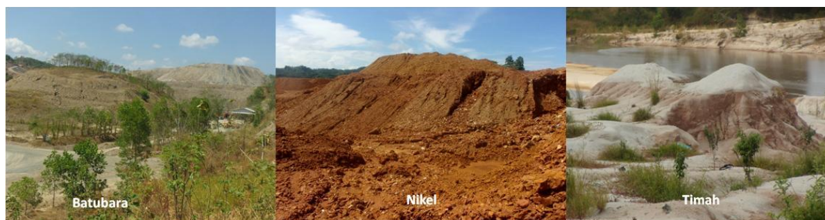
Gambar 1. Sisa-sisa bahan galian bekas tambang yang menyerupai bukit-bukit kecil Figure 1. The left over materials in the mined land in the form of scattered small hills

Dalam pengelolaan tanah pucuk atau lapisan tanah atas sering dihadapkan pada beberapa kendala, terutama dalam pengangkutan dan penyebaran di permukaan tanah, yang dapat sering mengalami pemadatan dan kerusakan pori tanah. Selain itu lapisan tanah atas cenderung masam, sehingga penggunaan amelioran seperti gipsum atau kapur sangat diperlukan. Dalam beberapa kasus diperlukan penambahan mikro-organisme simbiotik seperti pengikat nitrogen dan mikoriza. Pada areal berlereng pemberian lapisan tanah atas dan sistem penanaman harus sesuai kontur. Dengan cara tugal yang dalam agar penetrasi akar berkembang dan mengurangi benih yang hilang akibat erosi dan aliran permukaan.