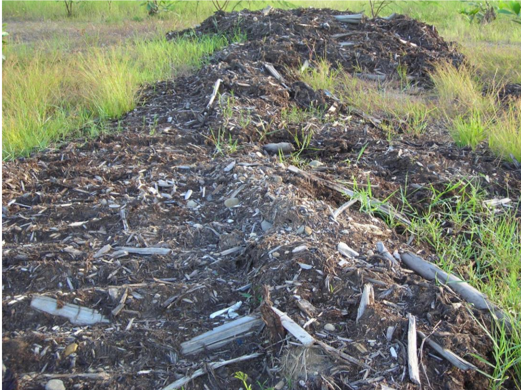
Gambar 4. Bahan mulsa dari serpihan dan serat kayu

Figure 4. Mulch materials from wood chips and fibers