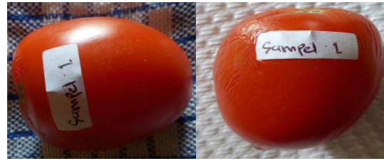
a. Pakai lilin b. Tidak pakai lilin Gambar 1. Warna buah tomat pakai lilin dan tidak pakai lilin

mengalami perubahan seperti terlihat pada Gambar 1.