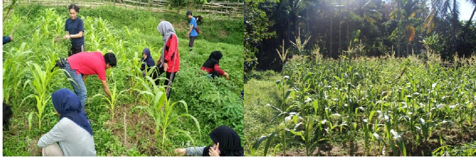
Gambar 5. Perawatan tanaman jagung dan ubi kayu

Rhizobakteri pemacu tumbuh tanaman yang lebih populer disebut Plant Growth Promoting Rhizobacteria (PGPR) merupakan kelompok bakteri menguntungkan yang secara aktif mengkolonisasi rizosfir. PGPR berperan penting dalam meningkatkan pertumbuhan tanaman, hasil panen dan kesuburan lahan (Wahyudi, 2009). Hal tersebut telah terlihat dari hasil panen jagung yang memiliki