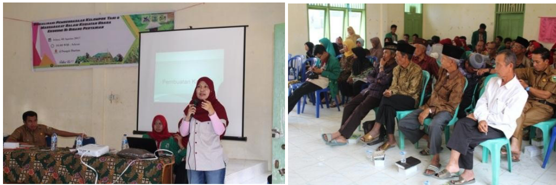
Gambar 2. Penyampaian Materi dan diskusi

tanaman palawija dengan aplikasi rizobakteri indigenos masyarakat memahami budidaya tanaman palawija yang baik, mengurangi penggunaan pupuk dan pestisida sintetis dan diganti dengan aplikasi rizobakteri indigenos. Maka dari itu lingkungan dan keseimbangan ekosistem di daerah sungai durian menjadi terjaga. Tidak hanya itu, kesehatan dari petani dan masyarakat juga terlindungi