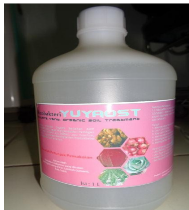
Gambar 4. produk rizobakteria indigenos

Perawatan yang dilakukan dalam budidaya palawija ini adalah pemupukan dan penyiangan gulma (gambar 5). Penyiangan gulma dilakukan 3 hari sekali untuk mengurangi persaingan unsur hara dan mengurangi terjadinya serangan hama