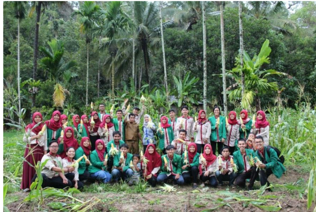
Gambar 6. Foto bersama setelah panen

Hasil panen budidaya palawija dijadikan berbagai produk olahan makanan berbahan utama jagung dan singkong. Sehingga nilai jual dari hasil tanaman menjadi lebih tinggi dan dapat menjadi peluang usaha bagi masyarakat.