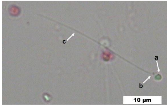
Gambar 1. Sperma ikan betok (a. kepala sperma, b. bagian tengah, c. ekor sperma)

panjang kepala, panjang bagian tengah, dan panjang ekor sperma berturut-turut 35,54 \pm 4,66 ; 1,83 \pm 0,20 ; 0,93 \pm 0,23 ; 33,05 \pm 1,40 \mu\text{m} . Lebar kepala sebesar 1,48 \pm 0,21 \mu\text{m} . Total estimasi durasi pergerakan sperma adalah 116 \pm 34 detik.