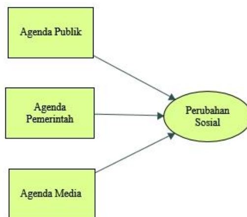
Gambar 3 Hubungan Agenda setting dan Perubahan Sosial

Sementara itu faktor-faktor yang menghubungkan agenda media dan perubahan sosial antara lain: