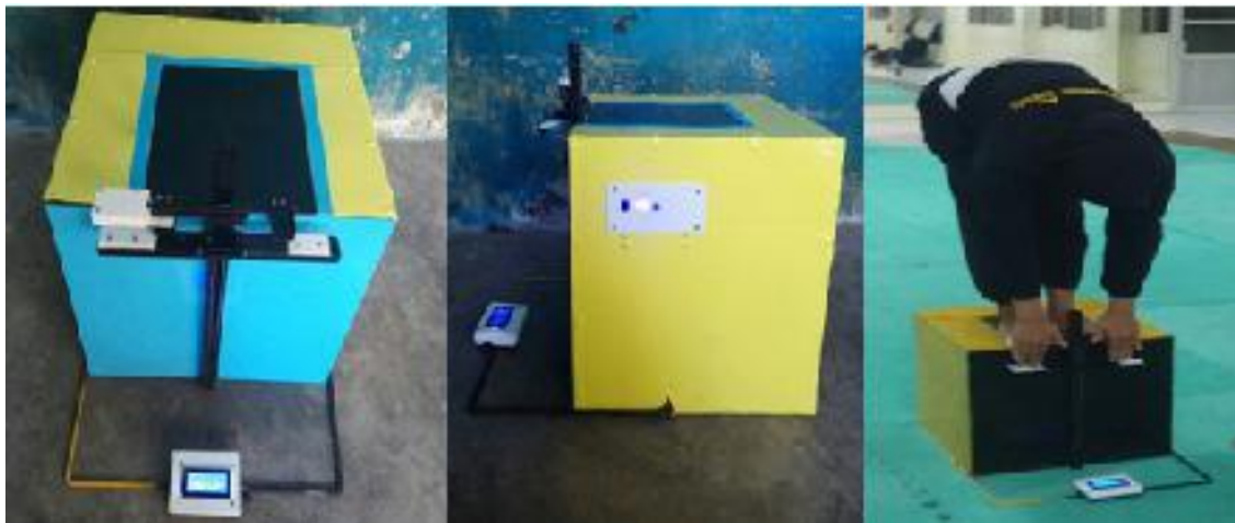
Gambar 3 Alat Tes Kelentukan

Produk pengembangan alat ukur kelentukan berbasis teknologi sensor ini dikembangkan untuk memberikan hasil yang lebih akurat dalam pelaksanaan pengukuran kelentukan sendi panggul atlet. Instrumen tes kelentukan berbasis sensor ini telah melalui beberapa tahapan yang sistematis. Salah satunya adalah uji coba