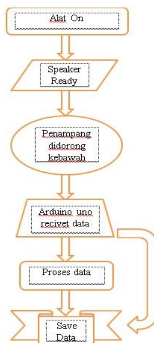
Gambar 2 Diagram Alir Pemograman Alat Ukur

Pengembangan alat ukur kelentukan berbasis sensor ultrasonik ini berupa alat yang digunakan untuk mengukur kelentukan sendi pinggul dengan menggunakan media pengukuran berupa sensor ultrasonik yang memiliki tingkat akurasi tinggi sehingga sangat cocok digunakan untuk mengukur kelentukan sendi panggul. Alat ini berbentuk seperti kotak yang memiliki satu tuas yang