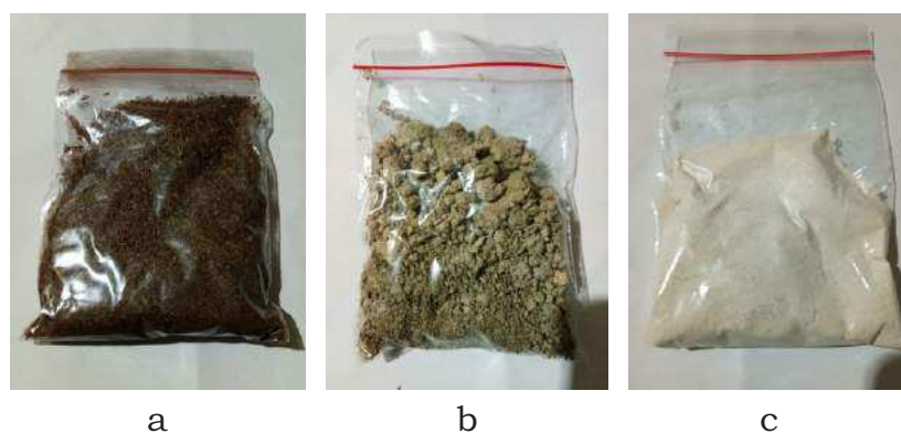
Gambar 1. Penampakan visual bahan selulosa yang digunakan (a) serbuk selulosa, (b) selulosa ongkok, dan (c) CMC

Bahan yang digunakan dalam penelitian ini meliputi karet SIR 20 yang diperoleh dari supplier lokal, serbuk kasar selulosa dari serat tandan kosong kelapa sawit (BM = 226.697,4 g/mol), selulosa ongkok dari limbah pati singkong (BM \approx 243.000 g/mol), CMC dari supplier lokal (BM=264,204 g/mol), serta bahan kimia komponding karet kualitas teknis dari supplier lokal. Adapun bahan kimia komponding karet meliputi: sulfur, asam stearat, seng oksida, bahan penyambung hexamine ( hexamethylenetetramine ) /resorcinol (1,3-isomer dari benzenediol ) dan anhidrida maleat, bahan pencepat CBS ( cyclohexyl benzothiazole sulfenamide ), antioksidan TMQ ( trimethyl dihydroquinoline ), serta bahan pelunak gliserol. Gambar untuk serbuk selulosa, selulosa ongkok, dan CMC disajikan dalam Gambar 1.