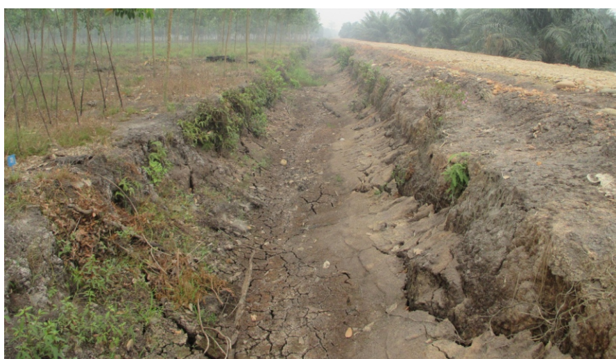
Gambar 2. Kondisi saluran drainase Oktober 2015 Figure 2. Condition of the drainage channel in October 2015

150 cm dan saluran drainase juga kering (Gambar 3). Musim kemarau tahun 2015 tidak berdampak terhadap penurunan pertumbuhan tanaman. Hal ini terlihat pertambahan lilit batang pada tahun 2015 masih mencapai ± 11 cm (Tabel 2).