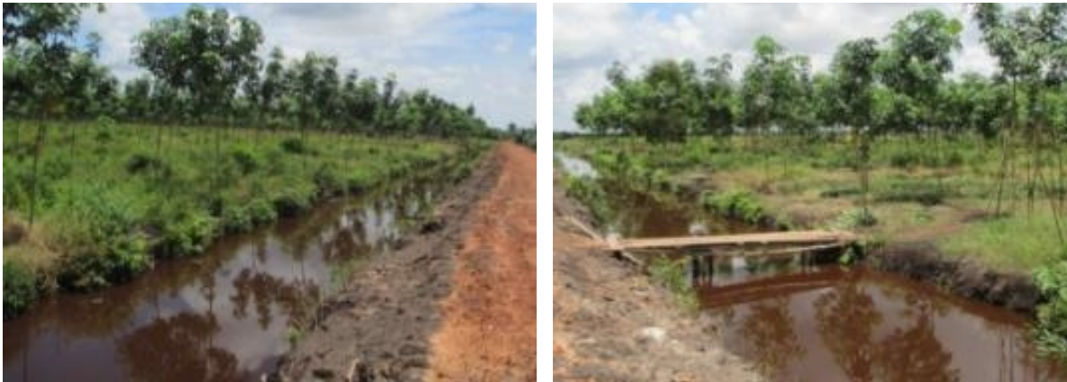
Gambar 3. Muka air gambut pada musim hujan Figure 3. Peat water faces during the rainy season