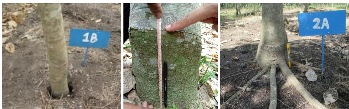
Gambar 6. Rongga di pangkal batang pada perlakuan penanaman dalam (A); Batang bawah yang sudah muncul dipermukaan pada perlakuan modifikasi bahan tanam (B); dan akar yang muncul di permukaan (C)

Figure 6. Cavities at the base of rubber plant stem for deep planting treatment (A); The rootstock that has appeared on the surface in the modification treatment of planting material (B); and roots that appear on the surface (C)