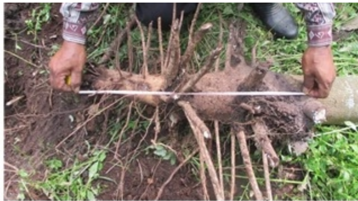
Gambar 4. Akar tanaman karet di lahan gambut Figure 4. Roots of rubber plants on peatlands

Penurunan gambut sampai dengan umur tanaman 18 BST (April 2015) cukup besar yakni 20 cm. Dari grafik penurunan gambut (Gambar 5), terlihat bahwa pada awal penanaman terjadi penurunan yang cukup tinggi dan setelah tanaman berumur 24 BST penurunan gambut menurun. Sepanjang tahun 2017 (36-48 BST), penurunan gambut hanya bertambah 1,38 cm. Pembuatan saluran drainase pada lahan gambut berpotensi meningkatkan oksigen sekitar 1,4 – 1,9 lebih tinggi dibandingkan pada saat keadaan tergenang/anaerob (Silins & Rothwell, 1999). Kondisi tersebut mengubah kondisi mikroba anaerob (seperti bakteri, fungi, dan jamur) menjadi mikroba