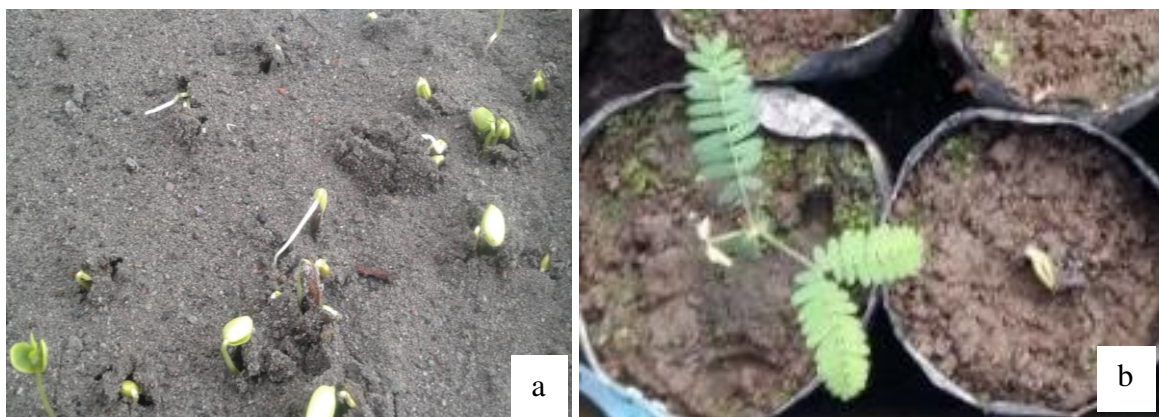
Gambar 1. Semai kaliandra (a) yang sehat dan (b) yang terserang penyakit lodoh

Setelah dilakukan isolasi dan diperoleh biakan murni jamur yang diduga sebagai penyebab penyakit lodoh, kemudian dilakukan uji patogenitas dengan uji Postulat Koch pada kecambah benih kaliandra sehat. Suspensi spora hasil isolasi dengan pengenceran 10 -2 disemprotkan secara merata pada kecambah kaliandra. Setelah itu dilakukan isolasi kembali kecambah benih kaliandra yang mati setelah diinokulasi. Hasil isolasi dan reisolasi jamur diidentifikasi dengan cara melihat struktur morfologi secara makroskopis dan mikroskopis isolat jamur pada media. Isolasi dan identifikasi dilakukan untuk mengetahui jenis patogen yang menyerang tanaman yang diamati (Agrios, 2005). Hasil identifikasi dengan melihat morfologi isolat jamur (Gambar 2 dan Gambar 3) diperoleh ada 2 jenis jamur yang menyebabkan penyakit lodoh, yaitu jamur Fusarium sp. dan Rhizoctonia solani . Johnson et al. (2014) menyebutkan bahwa penyakit lodoh disebabkan oleh jamur yang berada di dalam tanah (soil borne fungi). Jamur tersebut diantaranya adalah Pytium sp., Fusarium sp., Rhizoctonia sp., Phytophthora sp., dan jamur lainya (Abbasi, Conn, & Lazarovits, 2004).