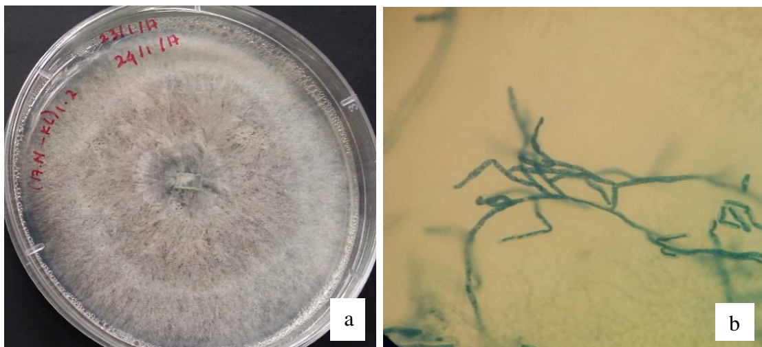
Gambar 2. (a) Isolat jamur Rhizoctonia solani (b) Jamur Rhizoctonia solani

yang tidak menguntungkan (Agrios, 2005). Jamur R. solani dapat berkembang baik pada kelembaban yang tinggi (> 80%) dan suhu 15-35°C. Jamur ini mulai menginfeksi tanaman sejak biji baru ditanam dengan mengeluarkan stimulan kimia yang dilepaskan oleh sel-sel yang terinfeksi ke tanaman selanjutnya dan menyebabkan gejala khas pada batang, pelepah, daun, dan bulir. Jamur dapat bertahan hidup pada musim dingin sebagai sklerotia pada sisa-sisa tanaman yang terinfeksi dan di dalam tanah (Soenartiningih, Akil, & Andayani, 2015).